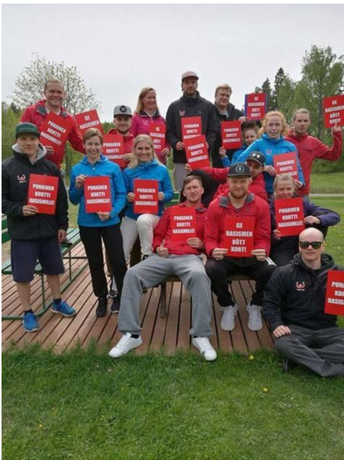
WAU ry:n henkilöstö on mukana Punainen kortti rasismille -kampanjassa